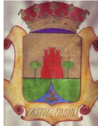
Primer diseño del escudo municipal de Castielfabib, 1962