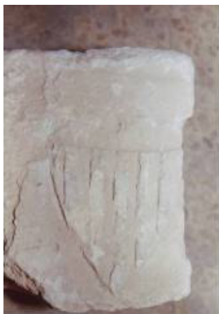
Detalle de capitel con las cuatro barras de la Casa de Aragón. Iglesia parroquial de Nuestra Señora de los Ángeles. Castielfabib.