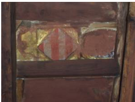
Primitivo escudo de la villa. Coro de la ermita de Nuestra Señora de la Huerta. Ademuz