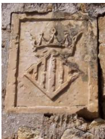
Primitivo escudo de la villa de Ademuz. Molino de Vallanca

Uno de los edificios más antiguos de la población es el horno. Su puerta es de piedra y arco redondo, viéndose blasonado con escudo real (barras de Aragón y corona abierta), grabado sobre cuadrado sillar y moldurado.