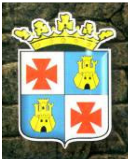
Escudo oficial de Ademuz desde 1971

La respuesta de la municipalidad de Castielfabib al Ministerio de la Gobernación se dilató cuatro años. La explicación a este hecho la da la misma correspondencia municipal que se excusa por “el cambio de funcionarios del ayuntamiento” y que ha hecho que el expediente no fuese enviado hasta febrero de 1966 al ministerio, informes que en abril ya se encontraban en la Academia de la Historia. En octubre de ese mismo año todavía la Real Academia de la Historia no había emitido informe alguno. El 25 de noviembre la academia exigía aclaraciones sobre la heráldica municipal y los informes que la apoyaban, pues éstos “no determinan cual sea su respectiva heráldica del municipio, o dejan sin señalar que esa heráldica, por práctica antigua o por expresa concesión, es privativa del concejo”. Es decir, que ya entonces la Real Academia de la Historia parece cuestionar la antigüedad y autenticidad de dicho escudo.