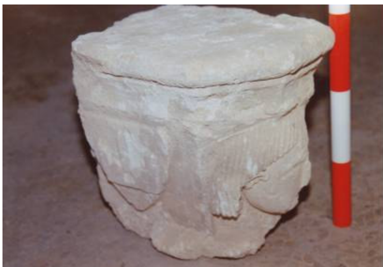
Capitel con la representación de un rostro masculino y de un castillo de tres torres, motivo éste último que adoptaría Castielfabib como heráldica municipal en época medieval. Iglesia parroquial de Nuestra Señora de los Ángeles. Castielfabib.

Por lo que respecta al castillo de tres torres del segundo capitel, su lectura se presenta menos evidente. Quizá la interpretación más plausible sea la lanzada por Francisco Cervera, arquitecto que dirige los trabajos de restauración del edificio, afirmando que puede tratarse de la heráldica del castellán hospitalario de Amposta. Esta idea se vería apoyada, además, por la aparición del rostro masculino tonsurado, que no sería otra cosa que la representación simbólica del monje-guerrero de la orden del Hospital.