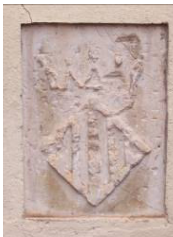
Primitivo escudo de la villa. Cambra Vieja del Trigo. Ademuz